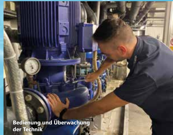
Bedienung und Überwachung der Technik