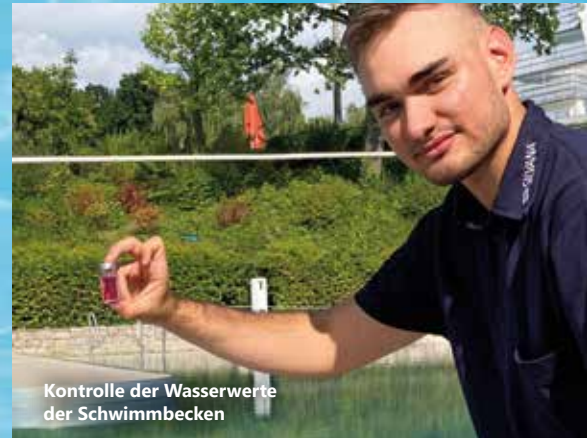
Kontrolle der Wasserwerte der Schwimmbecken

„In meiner Branche hat man viele Möglichkeiten. Ich würde mich gern zum Saunameister fortbilden. Man kann sich aber auch selbstständig machen oder in den Fitnessbereich wechseln. Ich habe die richtige Wahl getroffen. Mir macht mein Beruf wirklich Spaß.“