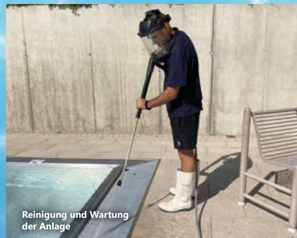
Reinigung und Wartung der Anlage