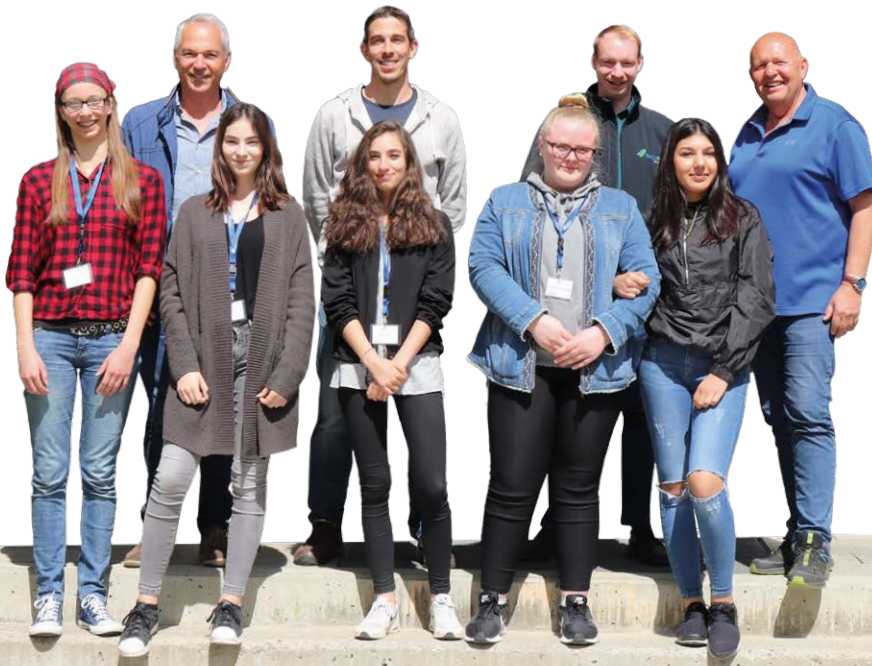
Einen Tag in die technischen Berufe der Stadtwerke Schweinfurt schnuppern, diese Gelegenheit hatten die fünf Mädchen am Girls'Day

unterwegs. Sie erhielten einen Überblick über mögliche Tätigkeitsbereiche eines Anlagenmechanikers beziehungsweise eines Elektrikers Fachrichtung Energie- und Gebäudetechnik. So wurden unter anderem die Gasübernahmestation Rothügel in Bergheimfeld und eine Erdgastankstelle besichtigt sowie eine Baustelle, an der Hochdruckleitungen gebaut werden. Wir hoffen, so das Interesse für den ein oder anderen Beruf geweckt zu haben und die Teilnehmerinnen als Auszubildende für die Stadtwerke gewinnen zu können.