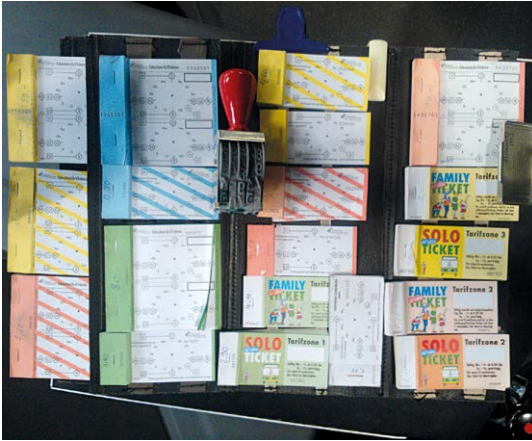
Ausgedient: Zum Jahresende verfallen die bisherigen Papiertickets endgültig