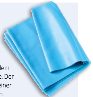
Perfekt auch für das Training zu Hause: das flexible Theraband

Am 12. April 2018 war es wieder so weit. Für die Mitarbeiterinnen und Mitarbeiter des Verkehrsbetriebs hieß es: Raus aus dem Bus oder Büro und rein in die Turnschuhe. Der Schwerpunkt für die Mitarbeiter lag bei einer Ernährungsberatung, Übungen für den Rücken und einem Gesundheitscheck vor Ort. Durch sportliche Betätigung konnten sich die Teilnehmer eine Vitaminbombe in Form eines frisch gepressten Orangensaftes „erarbeiten“. Um auch zu Hause fit zu bleiben, gab es für jeden ein Theraband.