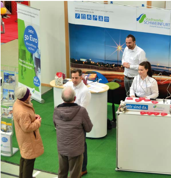
Die Messebesucher nutzten die Gelegenheit, sich über das Angebot der Stadtwerke zu informieren